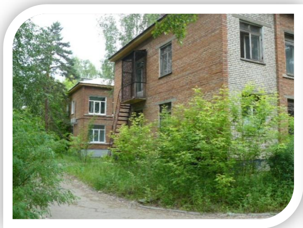
Фото Имущественного комплекса «Здание торгового дома. Помещение № 2 с земельным участком»