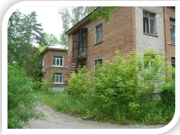
Фото Имущественного комплекса «Здание торгового дома. Помещение № 2» с земельным участком