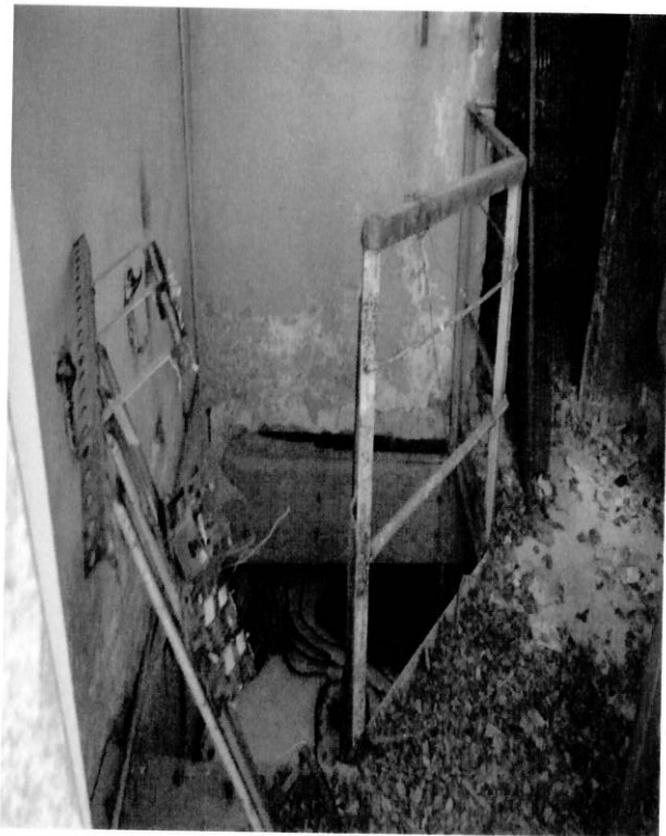
Спуск в подвальное помещение