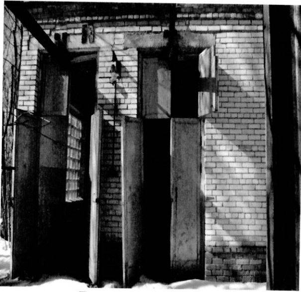
Вход в помещение