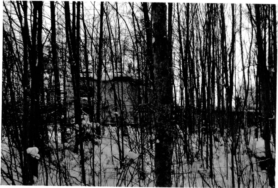
Вид на прилегающую территорию