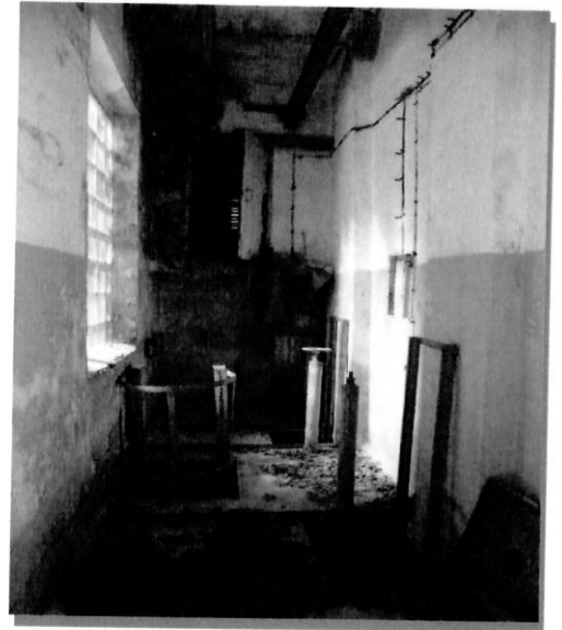
Вход в помещение