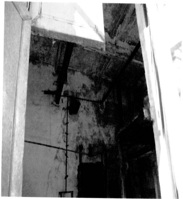
Вид внутри сооружения