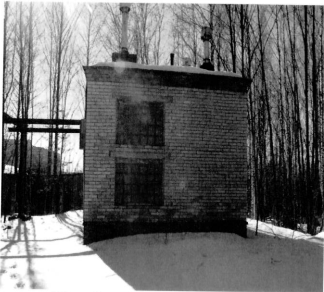
Общий вид сооружения