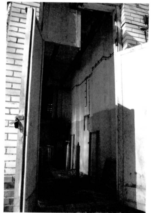
Вход в здание на 1 этаж