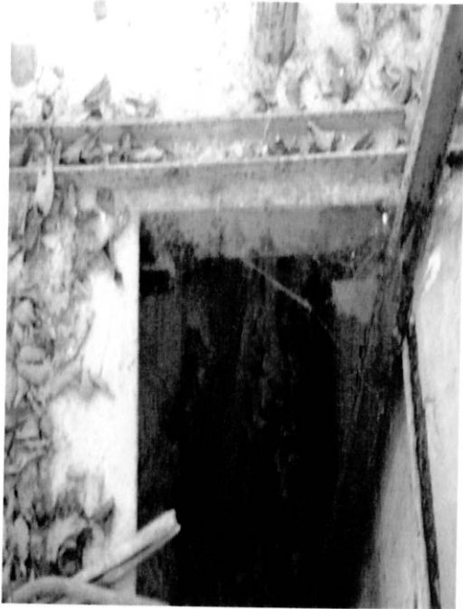
Вид на подвальное помещение