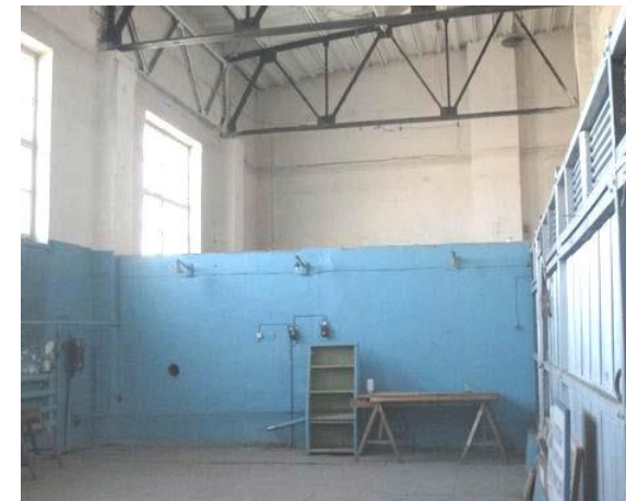
Помещение Котельной №1