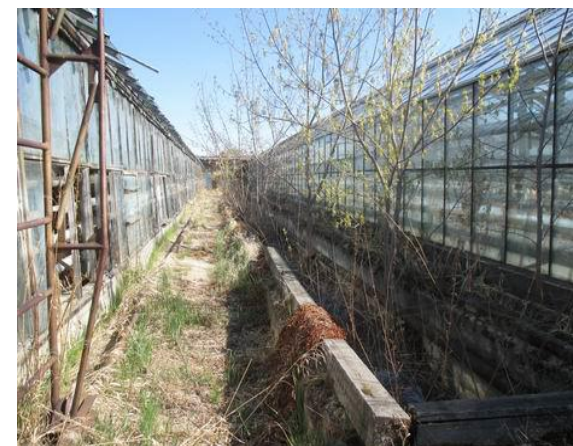
Парник №1, №2