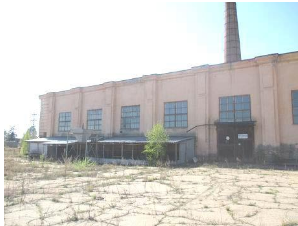
Помещение Котельной №1