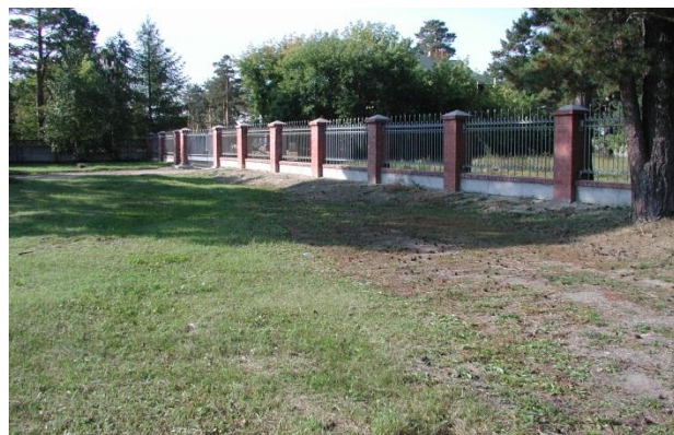
Земельный участок для эксплуатации Профилактория на 150 мест, газораспределительного пункта со складом баллонов профилактория