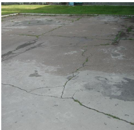
Асфальтовое покрытие хозкорпуса профилактория