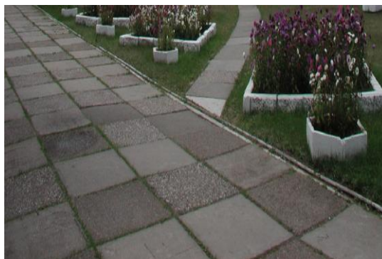
Асфальтированные дорожки профилактория