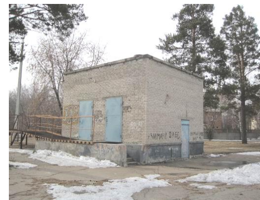
Газораспределительный пункт со складом баллонов профилактория