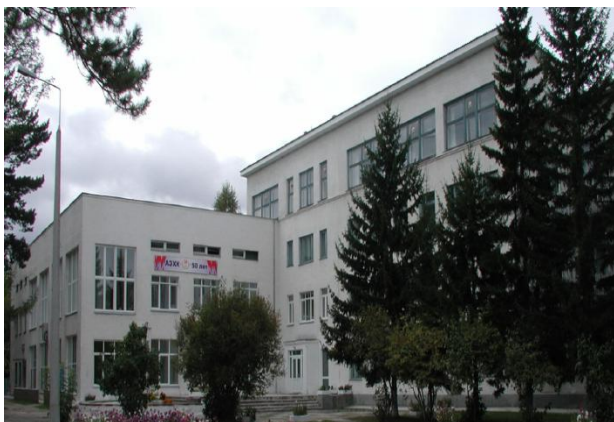
Профилакторий на 150 мест