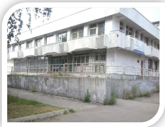
ФОТО Имущественного комплекса «Блок обслуживания с переходом (МЖК-1) 219 кв-л»