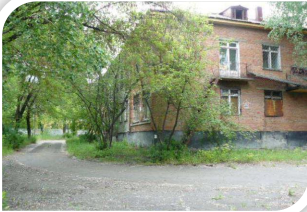
Фото Имущественного комплекса «Здание торгового дома. Помещение № 1» с земельным участком