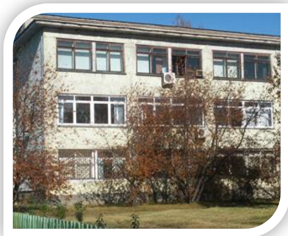
ФОТО Объекта недвижимого имущества «Здание учебно-консультационного пункта (УИСиТ) с благоустройством» вместе с земельным участком