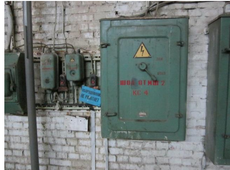
3. Шкаф управления ШУС-1, год выпуска 2004, местоположение – главный корпус АРЦ