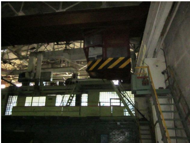
4. Кран мостовой КМ-10 г/п 10т., год выпуска 1972, местоположение – главный корпус АРЦ