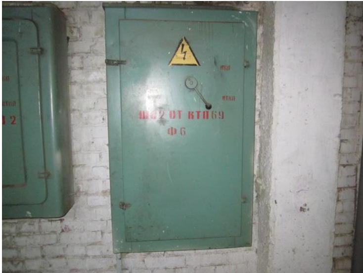
2. Щит автоматизированный ШУС-, год выпуска 2004, местоположение – главный корпус АРЦ