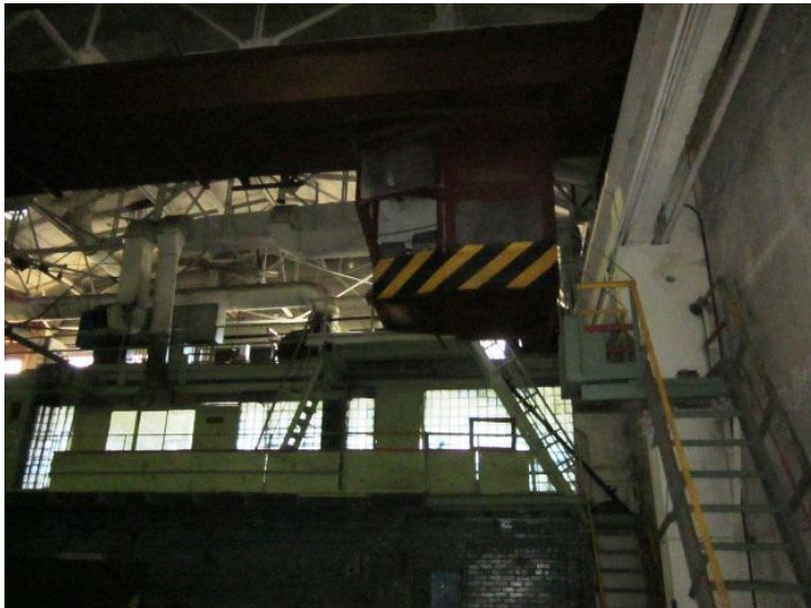
4. Кран мостовой КМ-10 г/п 10т., год выпуска 1972, местоположение – главный корпус АРЦ