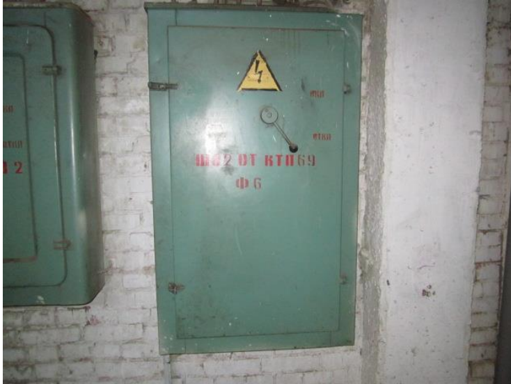
2. Щит автоматизированный ШУС-, год выпуска 2004, местоположение – главный корпус АРЦ