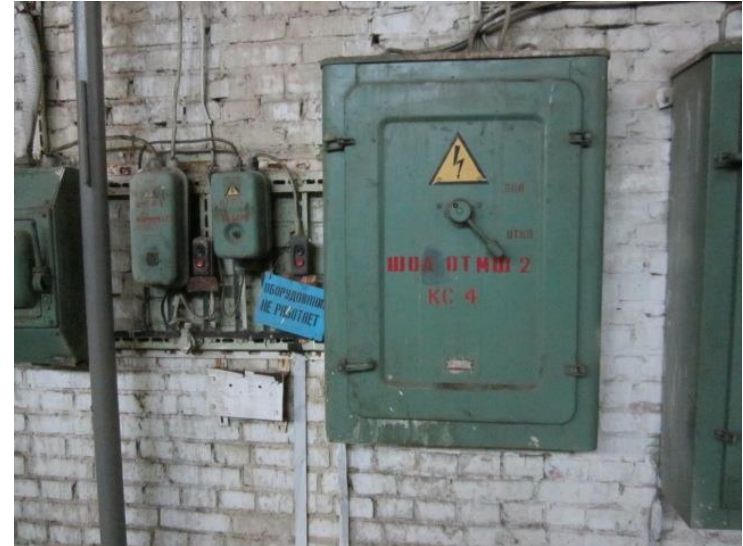
3. Шкаф управления ШУС-1, год выпуска 2004, местоположение – главный корпус АРЦ