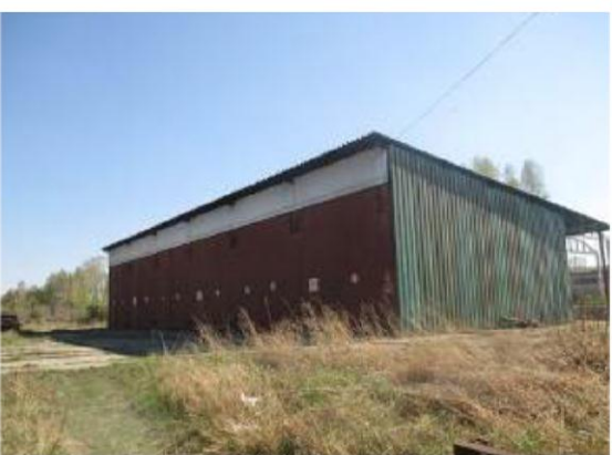
Склад - навес