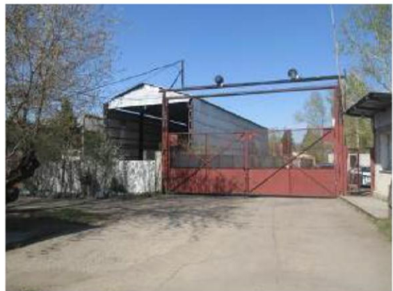
Подъезд к складу