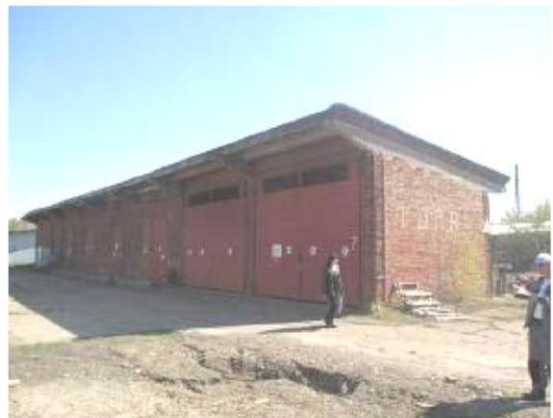
Склад сыпучих материалов