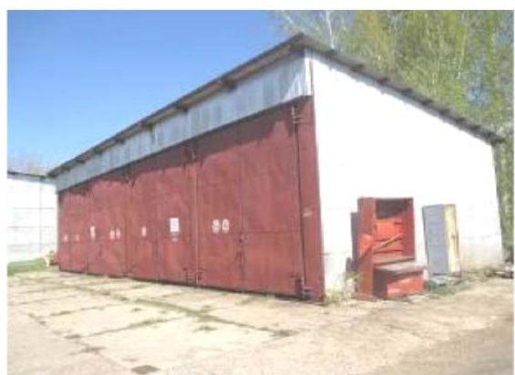
Навес для хранения оконного стекла